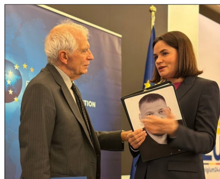
Жузэп Бурэль і Святлана Ціханоўская нацыянальную ідэнтычнасць”, – лішюць аўтары.

“Ім патрэбна мэтанакіраваная дапамога – фінансавая, тэхнічная, палітычная – каб падтрымліваць пільму свабоды. Мы павінны супрацьстаяць дэзынфармацыі, падтрымліваць сем'і рэпрэсаваных і ўмацоўваць ініцыятывы, якія выходзяць