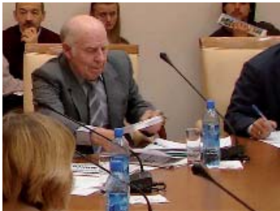
Канферэнцыя “Ідэнтычнасць беларусаў: сучаснае вымярэнне” (Масква, Расія)

Паводле сайта “Беларусы Масквы” (www.belmos.ru)