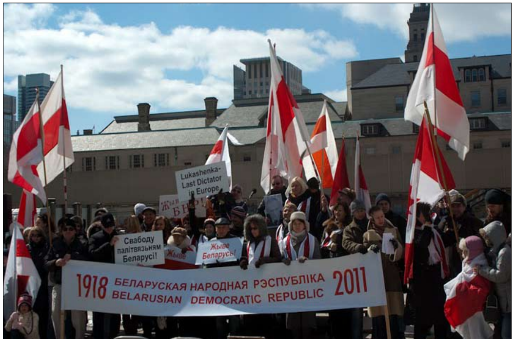
Дзень Волі ў Таронта