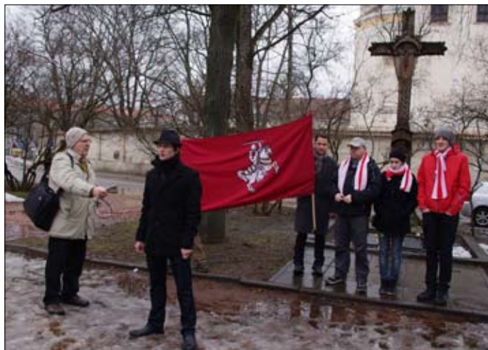
Пра Кастуся Каліноўскага распавядае Артур Яўмен