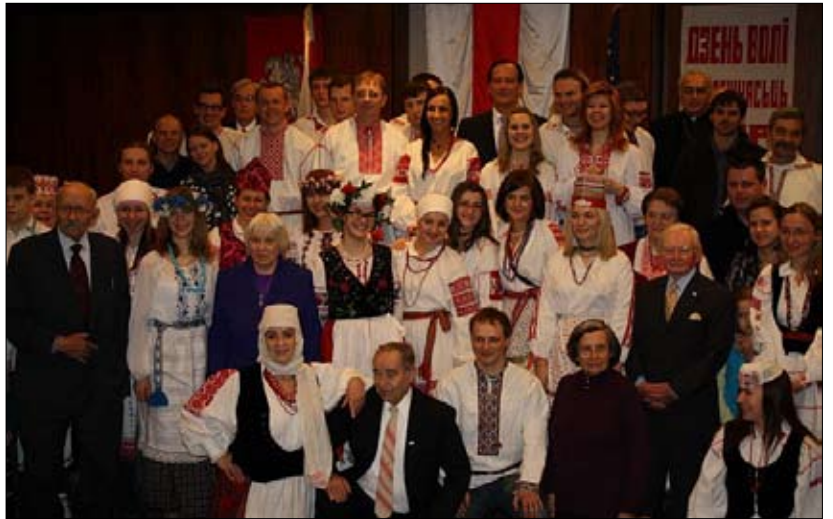
Удзельнікі святочнай вечарыны ў Нью-Брансвіку

Беларусы Гданьска 25 сакавіка ўсклалі кветкі да магілаў беларускіх дзеячаў Серафіны і Лукаша Дзекуць-Малеяў і Козьмы Чурлы, пахаваных на гарнізонных могілках у Гданьску. У той жа дзень у Сопаце адбыўся "Канцэрт Свабоды", на якім выступілі бард Зміцер Вайццошкewіч і гурт "Рэха". 26 сакавіка адбылося ўскладанне кветак пад каменем