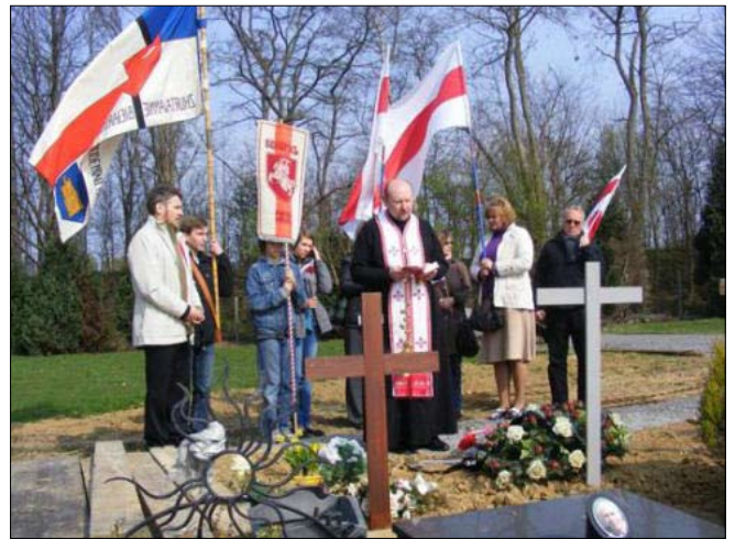
Дзень Волі ў Бельгіі