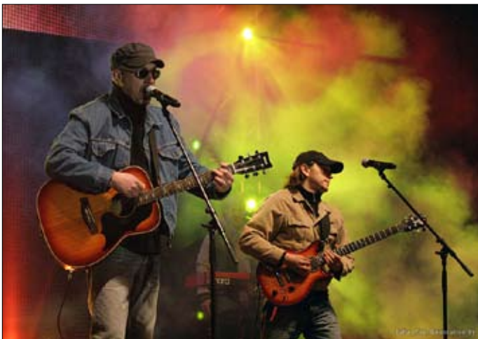
Канцэрт "Салідарныя з Беларуссю" ў Варшаве. На сцэне гурт "Крама".