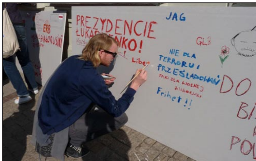
Гіганцкая паштоўка для ўладаў Беларусі

Падрабязней пра святкаванне Дня Волі ў суполках беларускай дыяспары чытайце на сайце zbsb.org