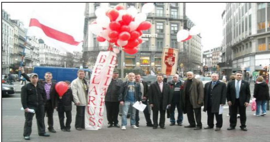
Дзень Волі адзначаюць беларусы Бельгіі

манстраваны дакументальны фільм Уладзіміра Арлова і Юрыя Хашчавацкага "Дзень Волі".