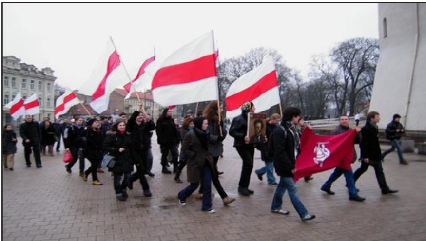
Шэсце ў Дзень памяці Кастуся Каліноўскага