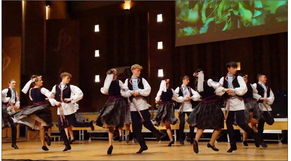
Выступ у Падляшскай філармоніі падчас гала-канцэрта фестывалю «Беларуская песня», 25 лютага 2023 года.

Восем гадоў заняткі “Падляшскага вянка” раз