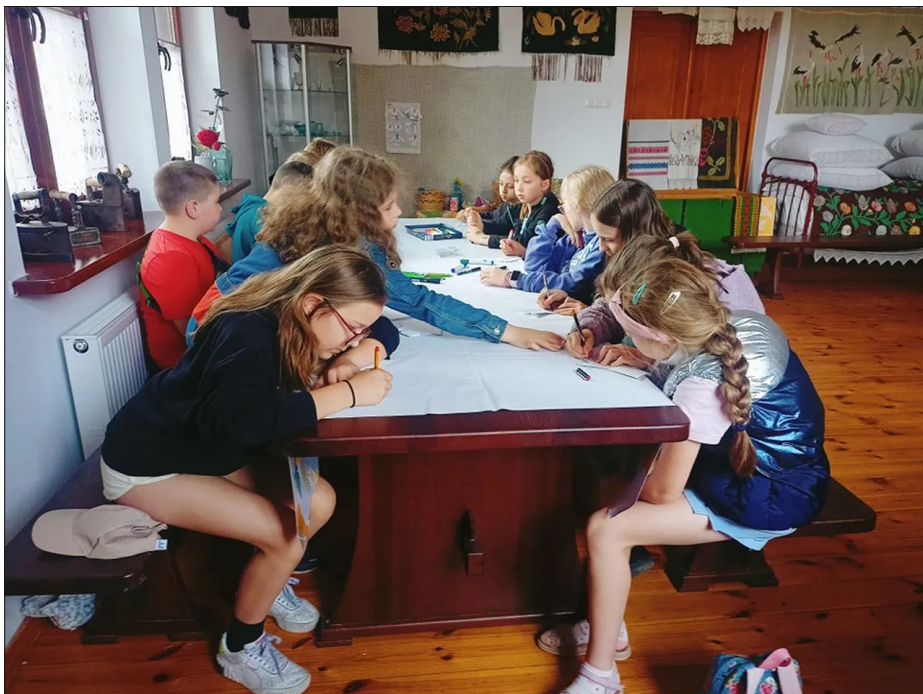
Летнік малодшай групы. Чэрвень 2023 года.

Па словах старшыні аб'яднання, сродкі выдаткоўваюць і самі бацькі. Напрыклад, для пакупкі танцавальных касцюмаў, паездак на выступы. Удзел у этнаграфічным летніку “таксама патрабуе фінансавага ўдзелу з боку бацькоў”.