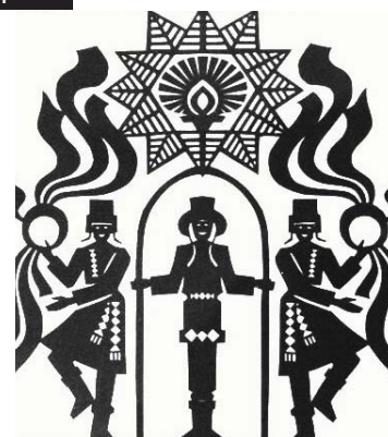
Беларуская калядная выцінанка

"Першае ўражанне, якое зрабіла на мяне таварыства, - ІТБК вядомае ў горадзе. А таксама ўразіла, што ўсе нацыянальныя таварыствы горада вельмі моцна паміж сабой сябруюць і наведваюць святы, якія ладзяцца іншымі. Так, на Калядах акрамя беларусаў прысутнічалі і літоўцы, і палякі, і татары. Шырокая дзейнасць Таварыства прызнана і на дзяржаўным узроўні ў выглядзе падтрымкі асобных дэпутатаў. Каляды мелі некалькі блокаў: вітанне старажылаў іркуцкай вобласці беларускага паходжання, танцавальны блок пад дуду,