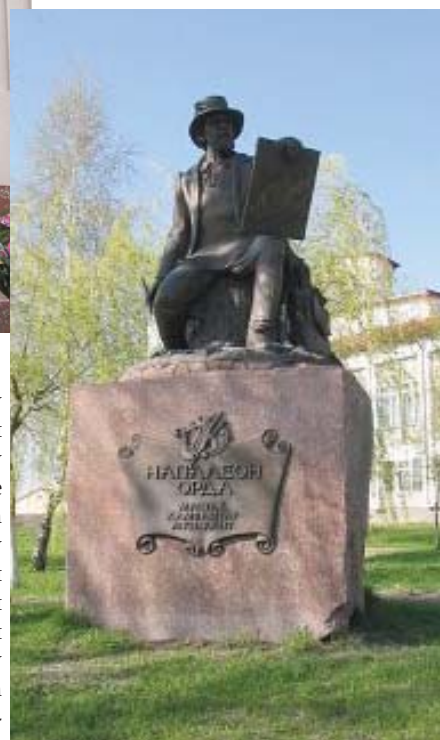
Помнік Напалеону Ордзе (Іванава)

Апроч нядаўніх Міцкевіча і Скарыны Мінск можа пахваліцца хіба яшчэ помнікам мастаку адраджэння Язэпу Драздовічу і схаваным ад шырокіх мас у панадворку БДУ секстэтам асветнікаў (Еўфрасіння Полацкая, Кірыла Тураўскі, Мікола Гусоўскі,