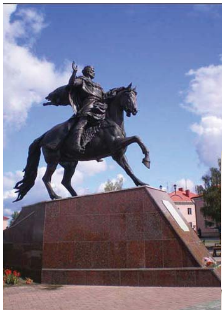
Помнік Усяславу Чарадзею (Полацк)

Напрыканцы мінулага года ў Беларусі адбыліся дзве сімптаматычныя падзеі. Навагрудскія ўлады абвясцілі, што ў 2009 г. у колішняй сталіцы Вялікага Княства Літоўскага з'явіцца конны помнік заснавальніку і першаму вялікаму князю ВКЛ Міндоўгу. У той жа час Міністэрства культуры адрынула прапанову грамадскасці пазбавіць помнік Леніну на плошчы Незалежнасці ў Мінску статуса гісторыка-культурнай каштоўнасці. Правінцыйны патрыятызм і сталічны посткаланіялізм – два абліччы сучаснай Беларусі.