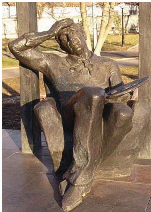
Помнік Марку Шагалу (Віцебск)

“15 гадоў таму, працуючы над “Таямніцамі полацкай гісторыі”, я выказаў спадзеў, што некалі студэнты Полацкага ўніверсітэта працягнуць традыцыі колішняй Полацкай езуіцкай акадэміі і пераедуць у старажытныя муры, дзе вучыліся і працавалі іх славутыя папярэднікі. Але я і падумаць не мог, што гэта адбудзецца так хутка! Сёння я лічу суцэльнай тэндэнцыяй аднаўленне ратуш (у Мінску, Магілёве, Шклове) як сімвалаў нашай еўрапейскасці. Працэс пайшоў, а значыць рана ці позна ўсё стане на свае месцы”, – адзначаў Ул. Арлоў.