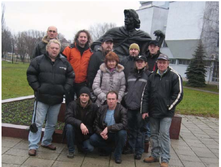
Сябры “Беларускага культурнага таварыства” з гуртом “Палац” (Калінінград, Расія)

Перад прэзентацыяй адбыўся пазачарговы сход ТБК, дзе разглядалі арганізацыйныя пытанні адносна стварэння беларускага культурнага цэнтру Якуба Коласа ў Вільні. У госці быў запрошаны ўкраінскі ансамбль “Світлиця”, які павіншаваў беларусаў са святамі і праспяваў калядкі на ўкраінскай