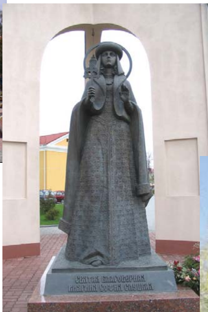
Помнік Саф'іі Слуцкай (Слуцк)

Мы ўжо 17 гадоў жывём у незалежнай краіне, але чамусьці помнікі нацыянальнаму герою Беларусі, Польшчы і ЗША літвіну Тадэвушу Касцюшку можна ўбачыць у трох польскіх і шасці амерыканскіх гарадах, а вось у Мінску – толькі на тэрыторыі амбасады ЗША.