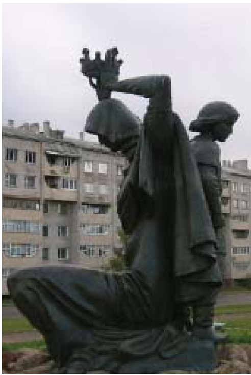
Помнік Рагнедзе і Ізяславу (Заслаўе)