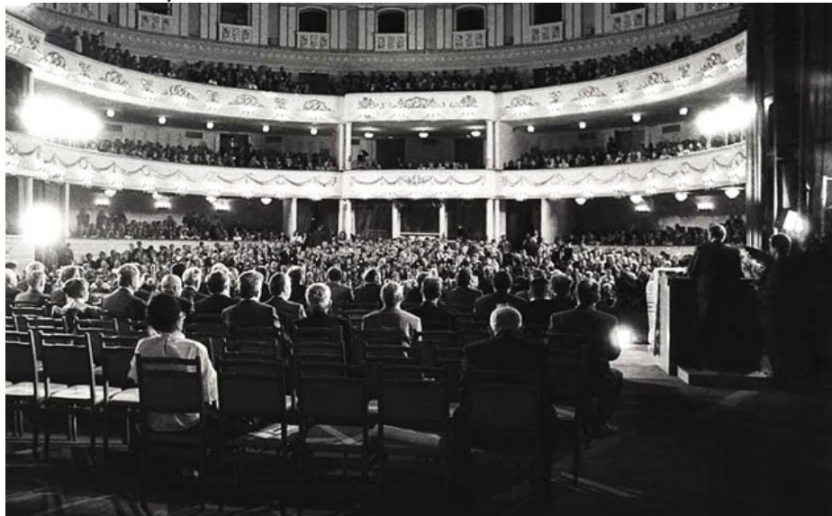
Пасяджэнне дэлегатаў Першага з’езда беларусаў свету

Пры падрыхтоўцы артыкула выкарыстаныя матэрыялы артыкула Дзяніса Марціновіча з сайта праекта 90s.by