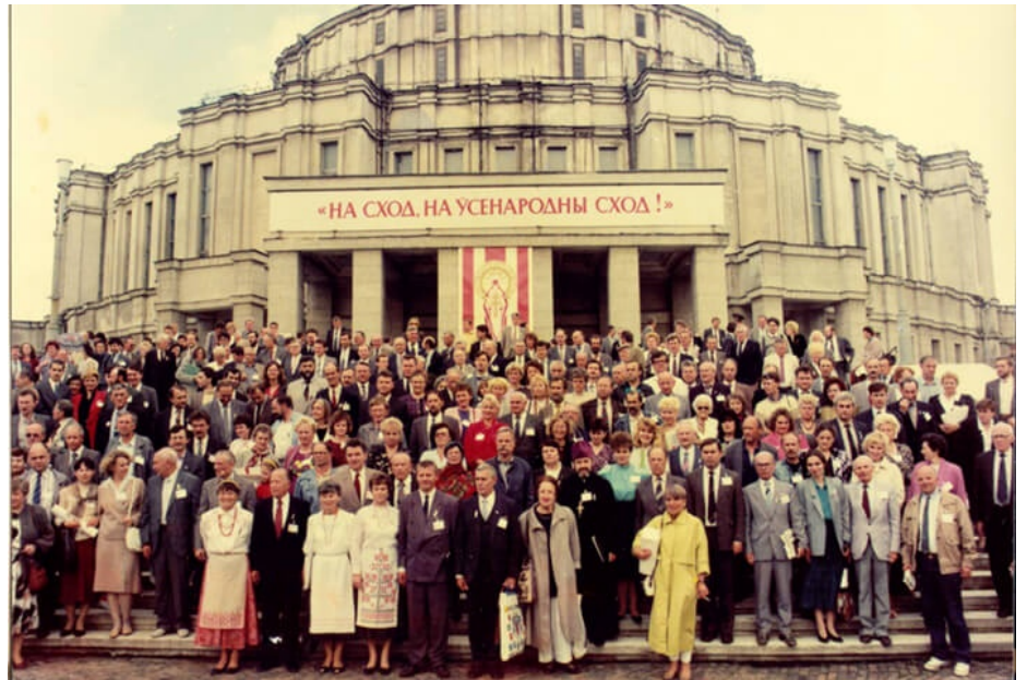
Удзельнікі Першага з’езда беларусаў свету