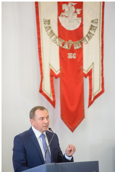
Уладзімір Макей на 3’м едзе беларусаў свету ў 2017 годзе

Але ніякай змены ў стаўленні да Беларусі не было. Як ужо казалі вышэй, беларусы ў Беларусі і за мяжой – гэта адно грамадства, падзеленае межамі. Як у Беларусі людзі стамляюцца і часам сыходзяць ва ўнутраную эміграцыю, ці ўвогуле адходзяць ад грамадскай дзейнасці, засяроджваюцца на побыце, так і тут. Я не падтрымліваю вось гэтага дзялення і высвятлення, хто павінен адказваць за змены ў Беларусі, беларусы, што ў Беларусі, ці тыя, хто з’ехаў. Усё роўна беларускія праблемы вырашаць толькі нам самім, і прычым супольна.