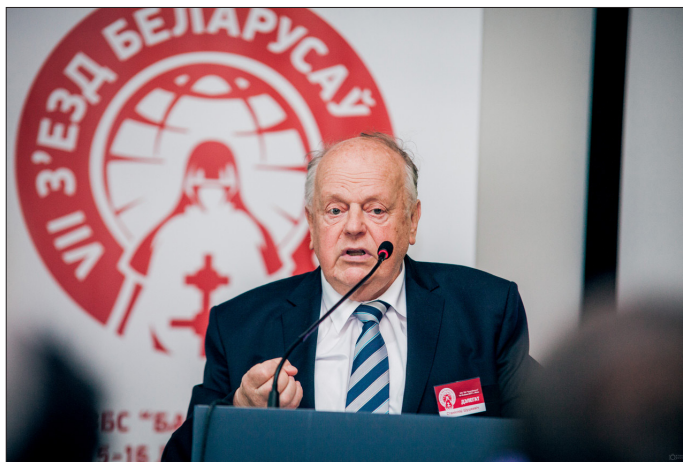
Станіслаў Шушкевіч на Сёмым з’ездзе беларусаў свету. 2017 год.

Ад сябе вельмі хачу падзякаваць усім сябрам ЗБС “Бацькаўшчына”, асабліва кіраўніцтву і выканаўчаму персаналу, за карпатлівую працу, за адданасць нашай ідэі, нашай надзвычайнай справе. З удзячнасцю згадваю ўсіх сваіх сяброў і папалечнікаў, з кім мы ладзілі той першы сусветны форум беларусаў. Іх імёны згаданы ў кнізе “Першы з’езд беларусаў свету”, якую мне ўдалося падрыхтаваць і выдаць яшчэ да ад’езду ў эміграцыю. У кнізе апісаная ўся гісторыя гэтай надзвычайнай падзеі.