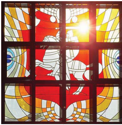
Вітраж на вакзале Віцебска

Працяг. Пачатак у № 86 “Беларусы ў свеце”