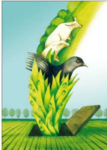
Паштоўка да свята Юр’я

Сярод першых крокаў на шляху да пашырэння нельга не прыгадаць дабрачынны канцэрт “Добры фэст”, які адбыўся 22 красавіка ў мінскім клубе “Рэактар”. У фэсце ўзялі ўдзел гурты “IQ48”, “Neuro Dubel”, “B:N”, “ZM99” (“Змяя”), Алег Хаменка (гурт “Палац”). Сродкі ад мерапрыемства пайшлі на падтрымку дзяцей-інвалідаў Чэрвенскага і Гарадзішчанскага дамоў-інтэрнатаў. На наступны дзень, зноў у “Рэактары”, у межах кампаніі “Будзьма беларусамі!” адбылася прэзентацыя ўнікальнага праекту-антрэпрызы “У нескладовае”, створанага вядомым беларускім музыкам Раманам Арло-