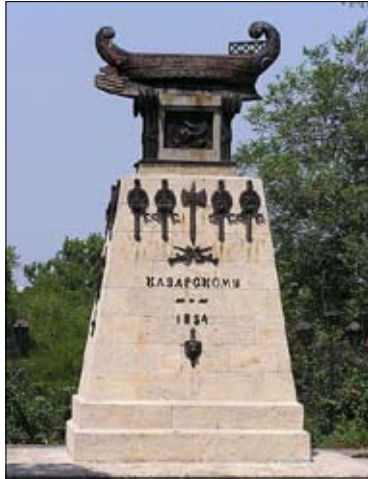
Помнік А. Казарскаму