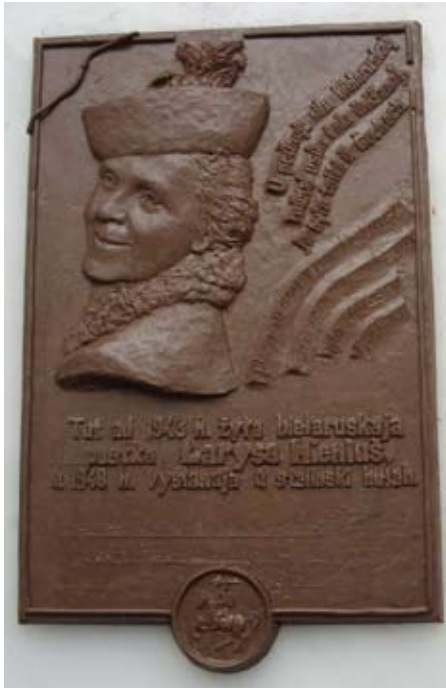
Эскіз Геніка Лойкі

“Геніюш блізкая мне па духу, – гаворыць пераможца. – Я лічу сябе яе нашчадкам. Таму я з задавальненнем узяў удзел у конкурсе. Да таго ж, я яшчэ і яе зямляк, я сам з Мастоўскага раёна”.