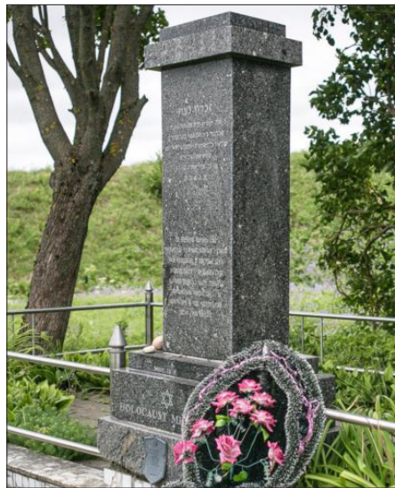
Памятны знак на адным з месцаў расстрэлу габрэяў у Наваградзкім гета

“Фонд Кушнераў выдзяляе да 60 тысяч далараў на праект, – кажа Вяршыцкая. – Сцяна будзе пабудаваная паводле ідэі таленавітага маладога скульптара Георгія Заборскага з вядомай дынастыі скульптараў”. Будаўнічыя працы