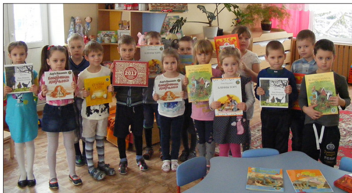
“Будзьма беларусамі!” і Саюз беларускіх пісьменнікаў правялі акцыю для беларускамоўных дзяцей у Лідзе.