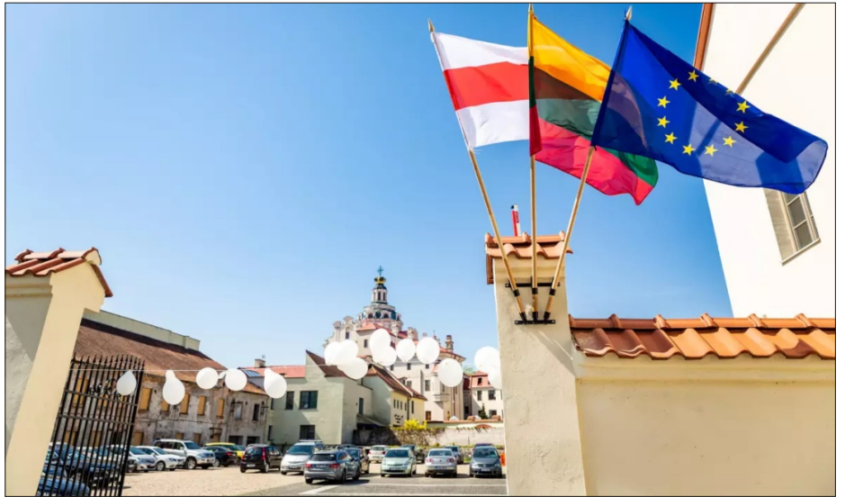
Сцягі Беларусі, Літвы і Еўразвязу на ўваходзе ў ЕГУ.

Па-другое, гэта безумоўна створыць вялізныя праблемы для актуальных студэнтаў і выкладчыкаў ЕГУ. Паводле звестак за 2023 год, колькасць студэнтаў універсітэта перавышае 1500 чалавек, абсалютная большасць з якіх – беларусы, якія працягваюць жыццё на радзіме ці перыядычна вяртаюцца з Літвы дадому. Што да выкладчыцкага складу, выходзячы з дадзеных на сайце ЕГУ, арганізацыяй і вядзеннем навучальнага працэсу цяпер займаюцца 130 супрацоўнікаў. І калі спісы студэнтаў агалошваюцца выключна на студэнцкай