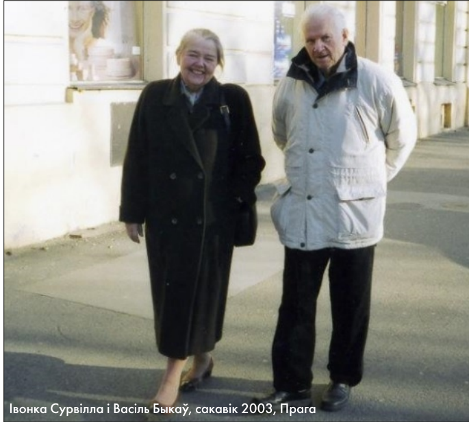
Івонка Сурвілла і Васіль Быкаў, сакавік 2003, Прага

“Быкаў узяў беларускую літаратуру на суветны ўзровень і быў у першым шэрагу змагання за аднаўленне незалежнасці Беларусі, за нацыянальнае Адраджэнне. Ён не баўся казаць праўду ў твар дыктатару і апошнія гады жыцця мусіў правесці на чужыне, – гаворыцца ў размешчаным на Facebook звароце. – Да гэтага часу ў сталіцы Беларусі, нягледзячы на шматгадовыя патрабаванні грамадскасці, няма ні вуліцы Васіля Быкава, ні помніка выбітнаму пісьменніку. Спынення і “быкаўскія дні” на